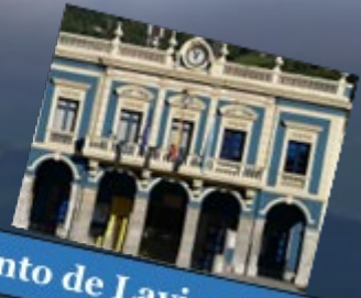
Ayuntamiento de Laviana.