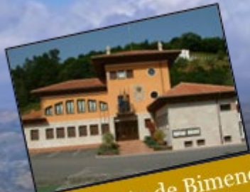
Ayuntamiento de Bimenes.